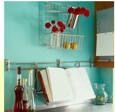
Cuisine collective « au mur turquoise »

feugiat dapibus eros tristique. Duis blandit ligula in fringilla blandit. Phasellus eleifend placerat convallis. Proin odio mauris, fermentum et rhoncus et, feugiat at odio. Nunc tempus adipiscing dolor vel suscipit. Pellentesque rutrum eleifend pulvinar. Phasellus neque augue, condimentum ac quam ac, sagittis rhoncus massa.